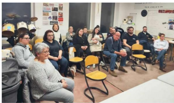
Les membres des Pellevoi'Zicos réunis à Pellevoisin pour leur assemblée générale.

Les Pellevoi’Zicos donnent donc rendez-vous aux habitants et aux amateurs de musique pour une année 2026 qui s’annonce festive.