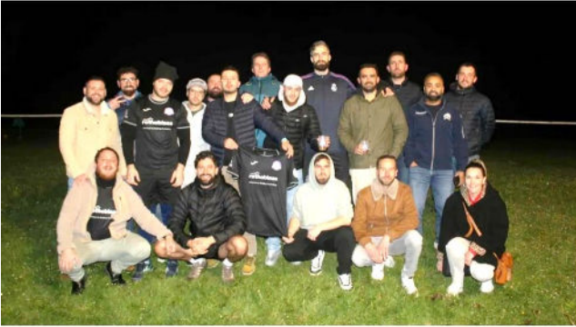
Les joueurs de la Titi Team Football Club réunis sur la pelouse de Pellevoisin.