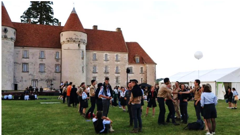
Les guides et scouts d'Europe ont installé leurs tentes aux pieds du château du Mée.