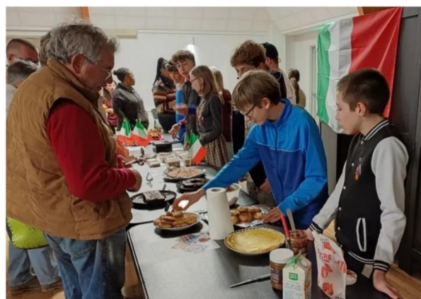
Les dix jeunes ont vendu des gâteaux sucrés et salés.

Départ prévu le 5 juillet. L'aventure sera à suivre sur les réseaux sociaux de l'AJEV confie Julie, l'animatrice.