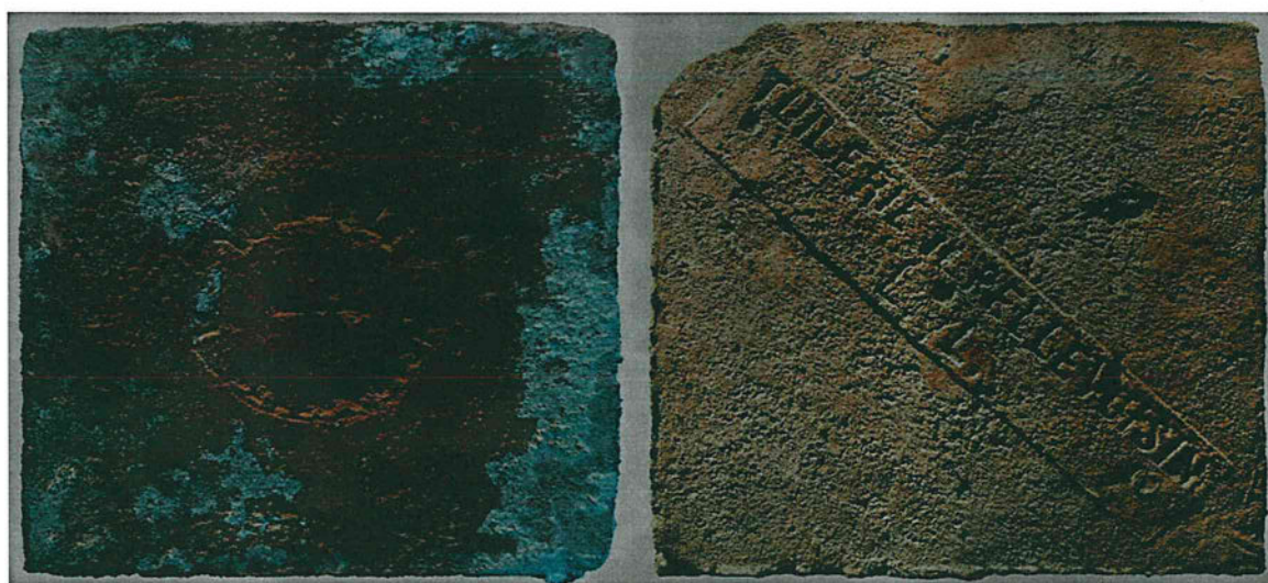
Figure 2. Carreaux de terre cuite fabriqués du temps du couple Louis-Louis (après 1877 – avant 1921). Dimensions : 16,5 cm de côté pour celui de gauche, 17 cm pour celui de droite. Sur le carreau de droite, la marque du propriétaire et tuilier est incluse dans un rectangle de 17,5 x 3,3 cm. Il est à noter que ces deux carreaux ont été retrouvés dans l'ancienne maison de Napoléon-François Louis.

Les recherches actuelles n'ont pas encore permis de connaître le nom du constructeur de la tuilerie, ni l'époque de sa mise en service. Grâce à la grande enquête statistique du préfet Dalphonse, résultat du collectage d'informations sur la démographie, l'agriculture ou l'industrie dans les communes du département vers septembre et octobre 1801, il apparaît qu'aucun établissement n'existe encore à Pellevoisin et sur le canton, seule celle de Préaux fonctionne. En revanche, une nouvelle enquête de 1811 indique sa présence. Il faudra attendre les années 1850 pour que deux nouvelles tuileries soient créées au chef-lieu de canton.