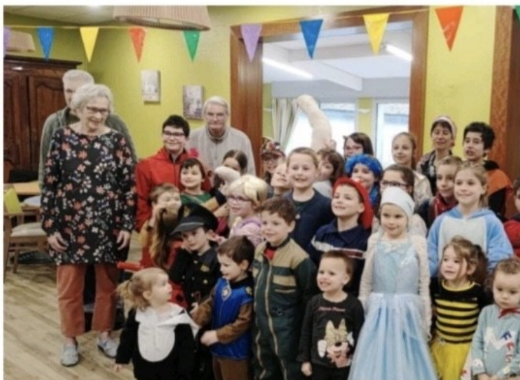
Une trentaine d'enfants présents à l'Ehpad Béthanie.

L'après-midi s'est terminé par un goûter et du jeu de la chaise musicale.